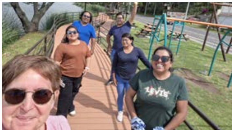
De stuurgroep – Een warme groep bereid om samen aan de slag te gaan