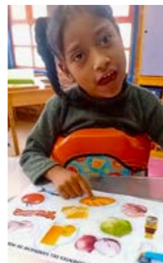
Visuele ondersteuning van communicatie

Velen vertelden over de emotionele weg van zoeken, niet altijd begrepen worden en toch blijven gaan. Hun veerkracht is indrukwekkend. Samen met het Tapori team willen ze werken aan wat echt verschil maakt: communicatie mogelijk maken bij kinderen die niet of nauwelijks spreken, en zelfstandige mobiliteit – in huis én daarbuiten. De nood is zichtbaar op straat: ouders die hun kind, tiener of volwassene op de rug dragen om een bus te halen, rolstoelen die niet mee mogen, een kind met hersenverlamming wiens mama hem 's morgens achterop de motorfiets naar Tapori brengt en 's middags terug naar huis, samen vastgebonden met een sjaal. We willen er niet aan denken wat er kan misgaan. Om bijvoorbeeld openbaar vervoer toegankelijk te maken voor kinderen met een motorische beperking moet er ook naar de overheid gekeken worden. Ouders zijn bereid om daar samen aan te werken. Net zoals de terugbetaling van hulpmiddelen door de overheid zou voor deze ouders een heel grote hulp zijn. Ook daar zal gelobbyd moeten worden. Mobiliteit is daarom een thema die de nodige stappen zal vragen.