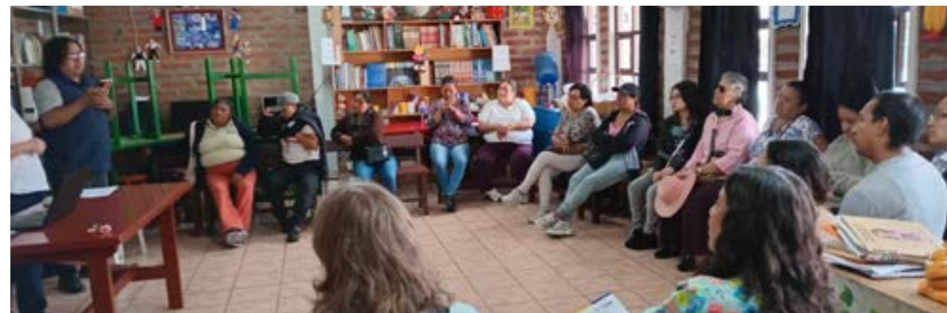
De kring met ouders – veerkracht als motor

in België: de schok van een diagnose en dan... wachten. Hoe ziet de toekomst van mijn kind er uit. Wie en hoe kan mijn kind het best geholpen worden. De zoektocht naar een plek in regulier of buitengewoon onderwijs. Soms zelfs een gesloten deur. Hoewel het thema "vroegbegeleiding" niet in het projectvoorstel werd meegenomen leek dat toch een heel belangrijk onderwerp en voor vele ouders heel cruciaal. De stuurgroep neemt dat nu enthousiast mee om er verder over na te denken. Dat ouders met hun verhaal centraal staan in deze aanpak wordt heel duidelijk in het gesprek met de ouders.