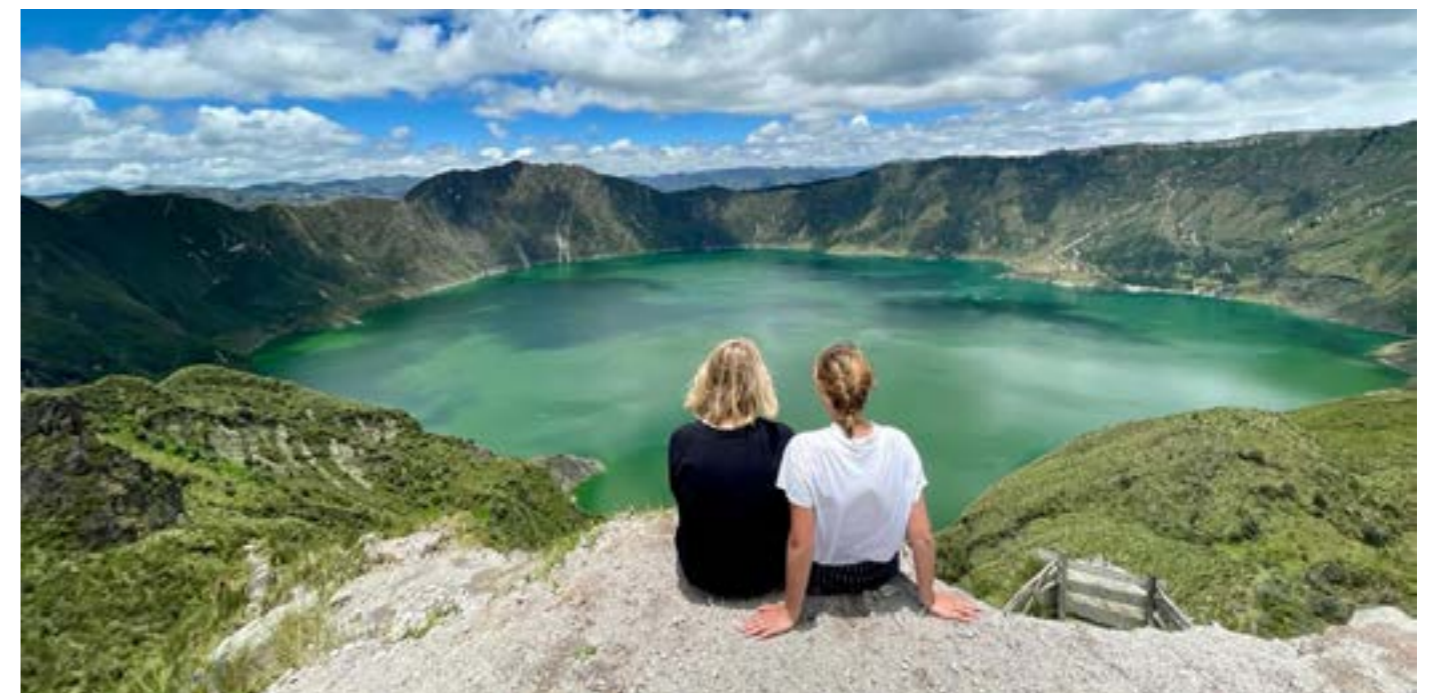
Anse en Manon bovenop de krater van het Quilotoameer, van geluksdagen gesproken!

WIJ,"AMIGOS DE TAPORI", ZIJN BLIJ MET JULLIE AANWEZIGHEID EN STEUN VOOR ONS PROJECT: "TAPORI ECUADOR"